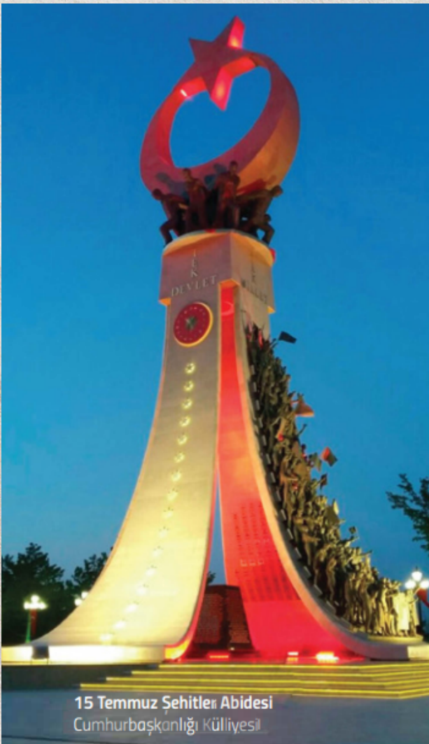
15 Temmuz Şehitler Abidesi Cumhurbaşkanlığı Külliyesi